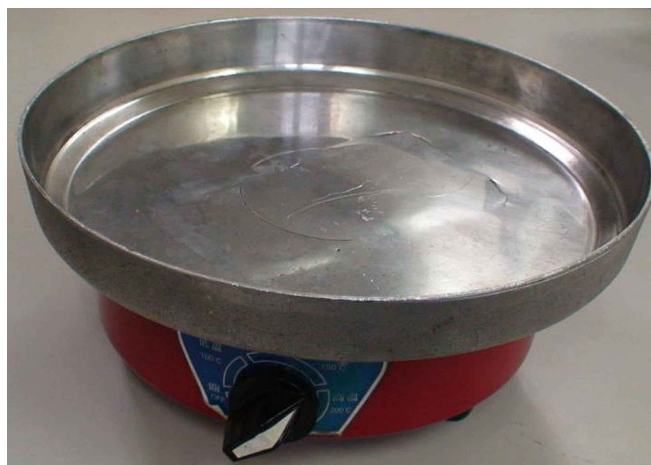
圖二、太陽能萬用鍋產品原型